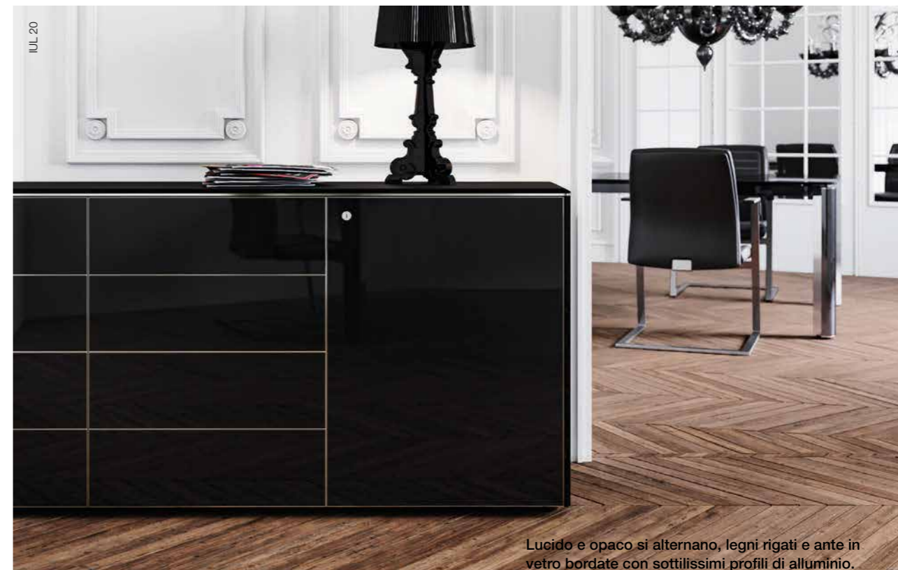
Lucido e opaco si alternano, legni rigati e ante in vetro bordate con sottilissimi profili di alluminio. Finiture contrastanti che esaltano ogni singola parte in modo diverso.