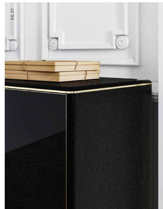
Polished and matt surfaces alternate with each other, striped wood and glass doors are framed with extremely slim aluminium profiles. Contrasting finishes that highlight each and every detail in a different way.