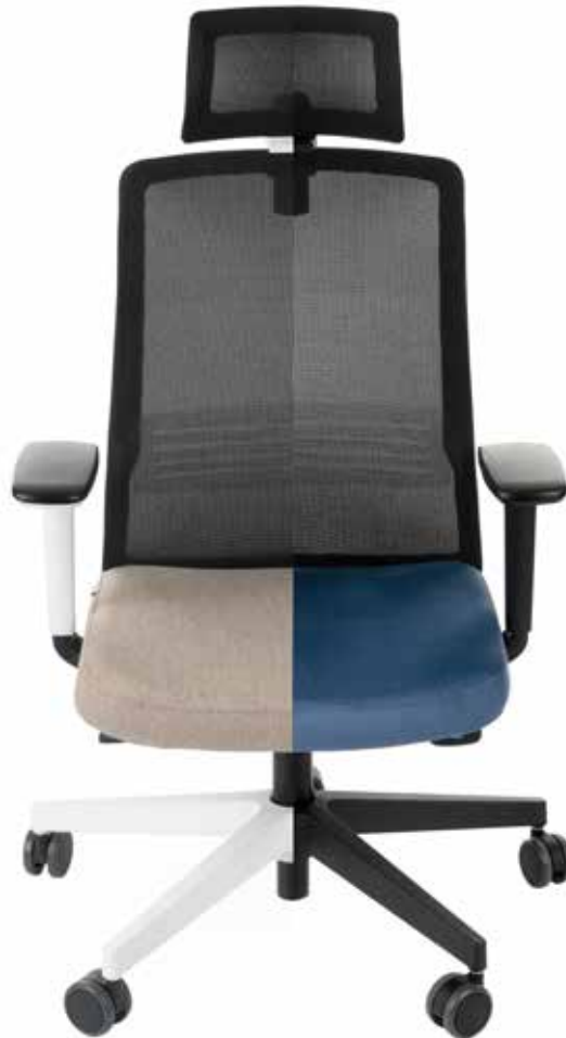
WERSJA WS (biały stelaż)