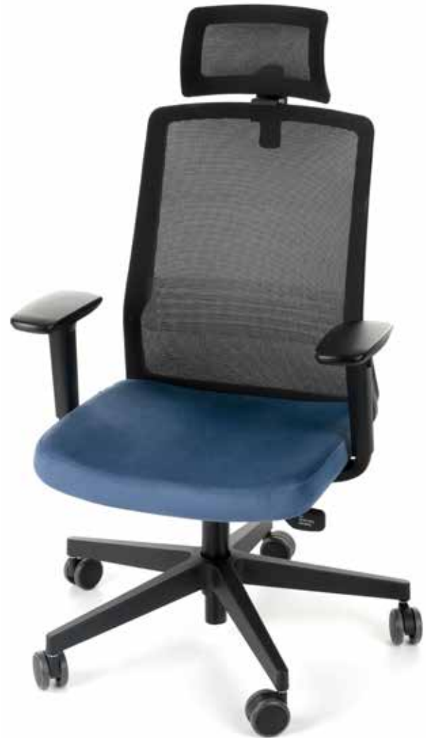
Coco BS HD