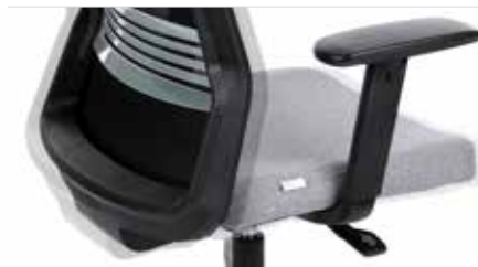
WERSJA BS (czarny stelaż)