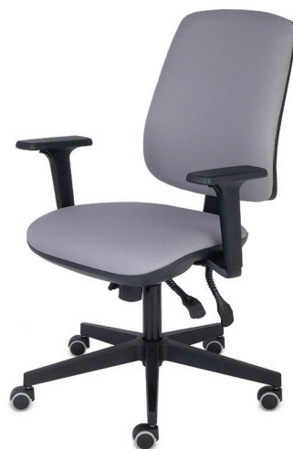
STARTER 3D Biurowe pracownicze