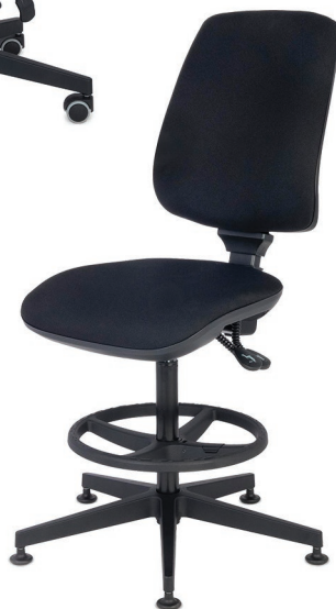
STARTER BP RING BASE Wysokie z podnóżkiem, bez podłokietnika