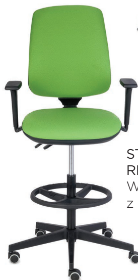
STARTER 3D RING BASE Wysokie z podnóżkiem, z podłokietnikiem 3D