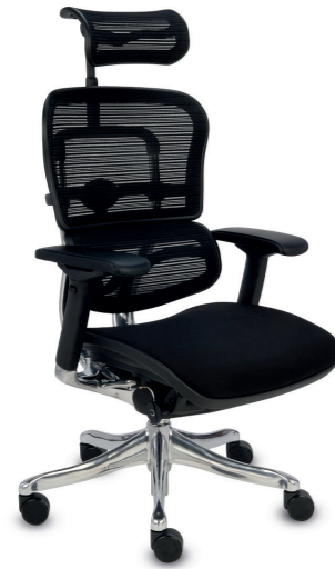
Ergohuman Plus Elite BT KMD31 Siatka Mesh + tkanina