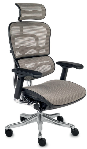
Ergohuman Plus Elite BS KMD30 Siatka Mesh + Siatka Mesh