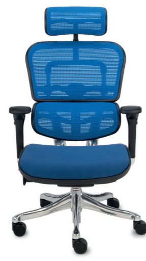
Ergohuman Plus Elite BT KMD35 Siatka Mesh + tkanina