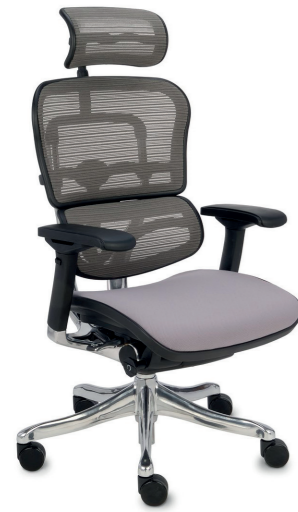
Ergohuman Plus Elite BT KMD30 Siatka Mesh + tkanina