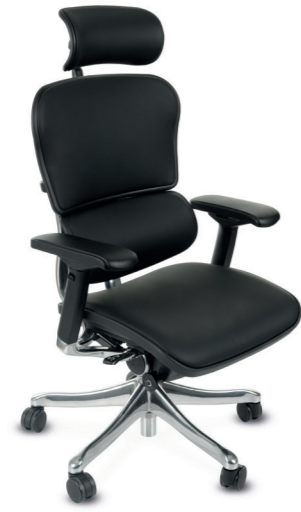
Ergohuman Plus Elite LE01 Naturalna Skóra Licowa