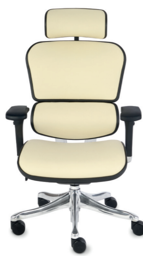
Ergohuman Plus Elite LE02 Naturalna Skóra Licowa

Wersja Ergohuman Color pozwala na tapicerowanie siedziska wybraną tkaniną.