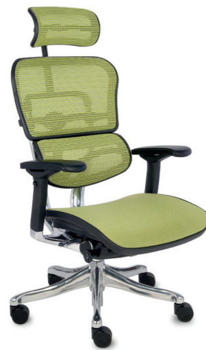
Ergohuman Plus Elite BT KMD34 Siatka Mesh + tkanina