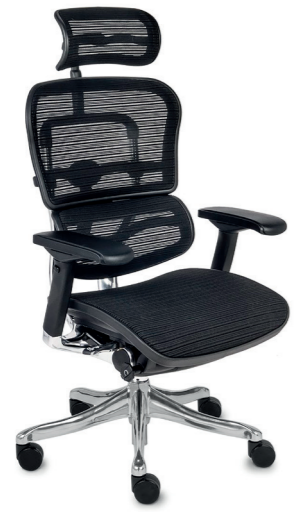
Ergohuman Plus Elite BS KMD31 Siatka Mesh + Siatka Mesh